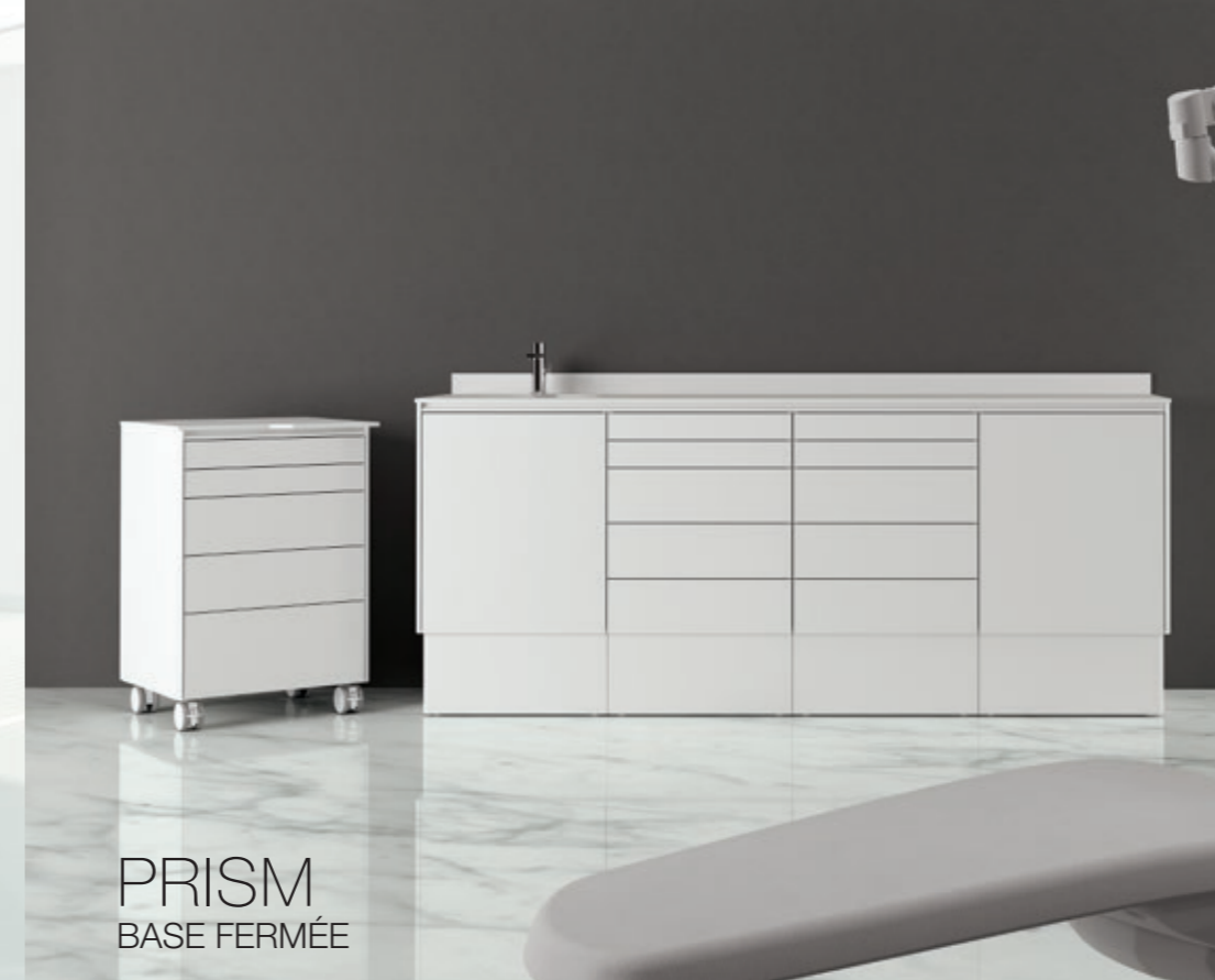
PRISM BASE FERMÉE