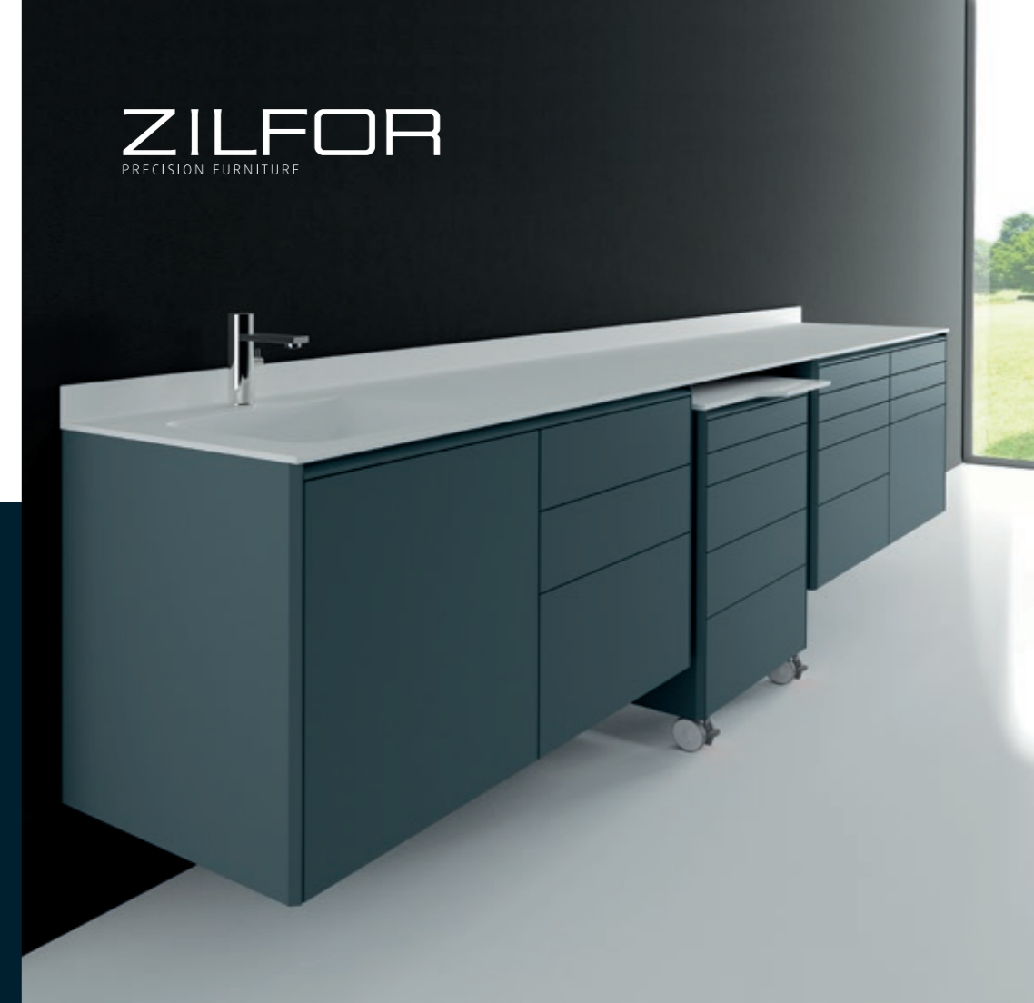
ZILFOR PRECISION FURNITURE