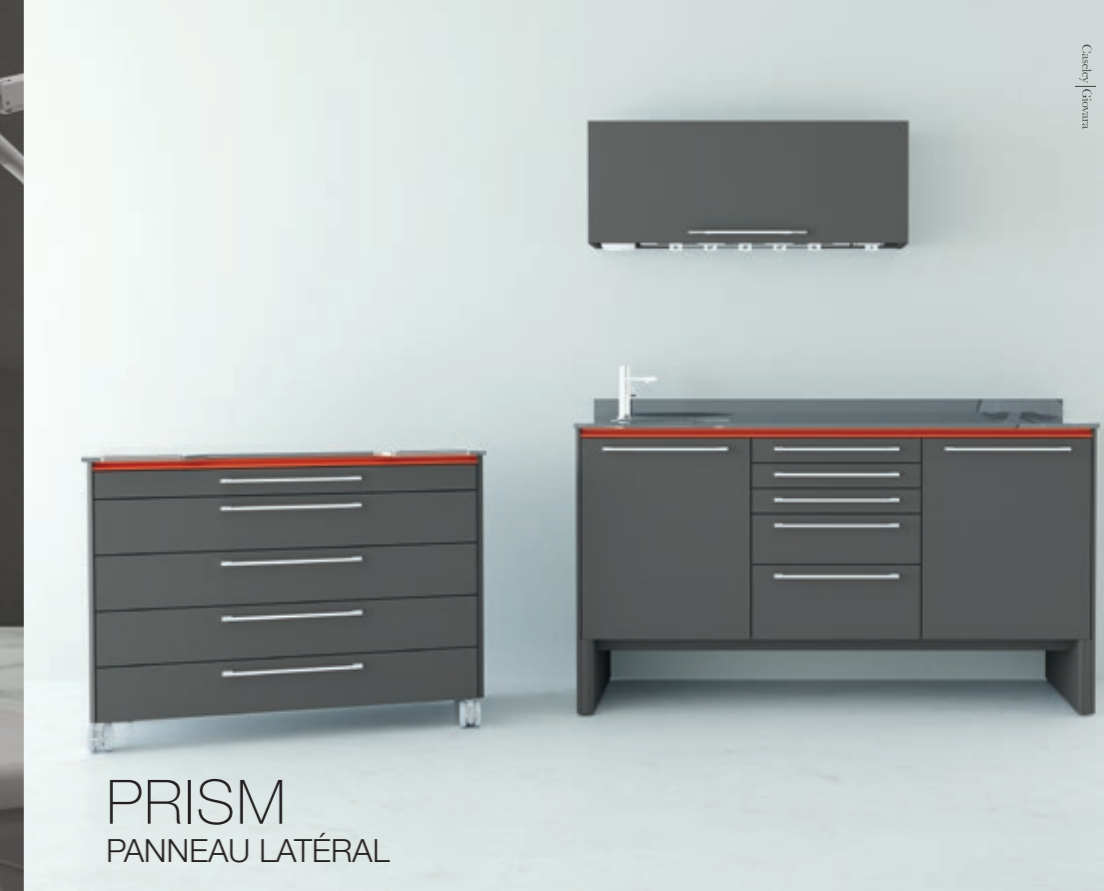
PRISM PANNEAU LATÉRAL

Moderne. Pratique. Robuste. Fait sur mesure.