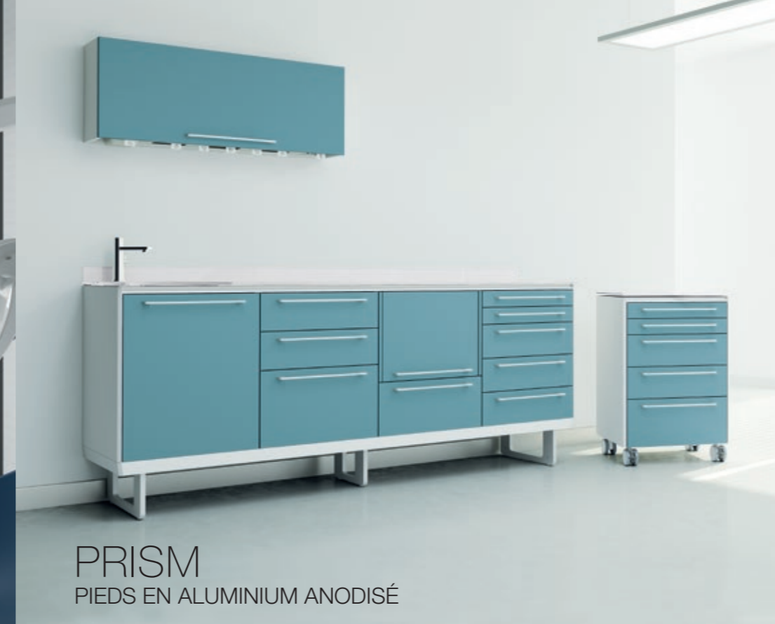
PRISM PIEDS EN ALUMINIUM ANODISÉ